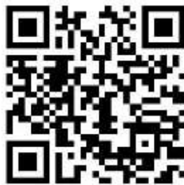
QR CODE การสมัครผ่านระบบออนไลน์

เนื่องจากสถานการณ์การแพร่ระบาดของโรคติดเชื้อไวรัสโคโรนา 2019 (COVID-19) การรับสมัครนักเรียน จึงขอปรับเปลี่ยนวิธีเป็นการสมัครผ่านระบบออนไลน์ ผ่านทาง QR CODE นี้ โปรดอ่านคู่มือการสมัครและอ่านคำแนะนำที่แจ้งไว้ใน Link ของการสมัครให้ละเอียด